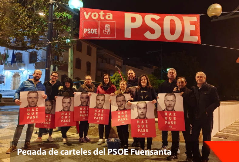
Pegada de carteles del PSOE Fuensanta