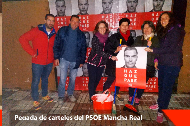
Pegada de carteles del PSOE Mancha Real