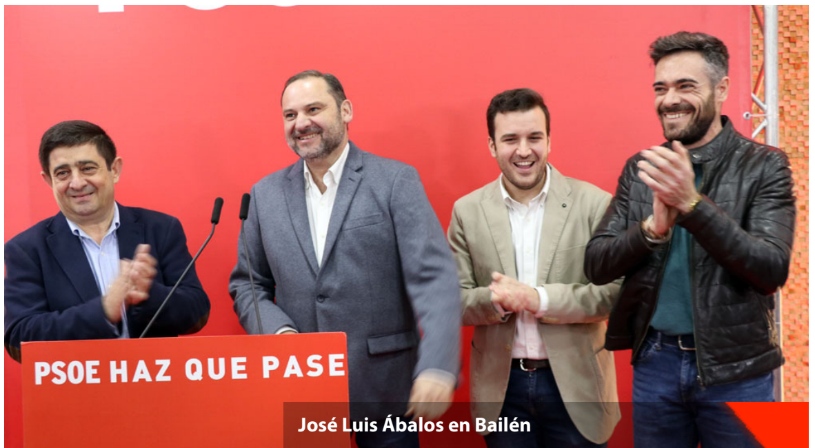
José Luis Ábalos en Bailén

Ábalos, que intervino en el acto de presentación de la candidatura del PSOE de Bailén a las próximas municipales, afirmó que todo lo que ofrecen las derechas "es negativo", porque quieren "Estado de Excepción, arrebatarse el poder autonómico, involucionar en derechos, conquistas y modelo constitucional,