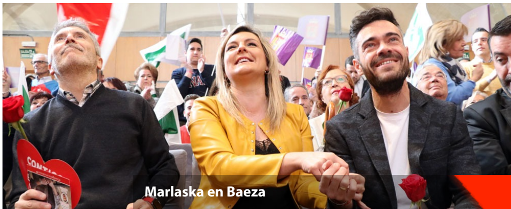
Marlaska en Baeza

El candidato al Congreso de los Diputados por el PSOE y ministro del Interior, Fernando Grande Marlaska, defendió hoy en Baeza la necesidad de seguir luchando por la igualdad y por los derechos para hombres y mujeres. “Tenemos todavía que luchar mucho más. De los 8.000 municipios que hay en España, no llegan al 20% los que están gobernados por mujeres. Por tanto, queda mucho camino por desarrollar. Y este Gobierno y el PSOE desde hace mucho tiempo tienen estas políticas como meta a corto plazo”, destacó