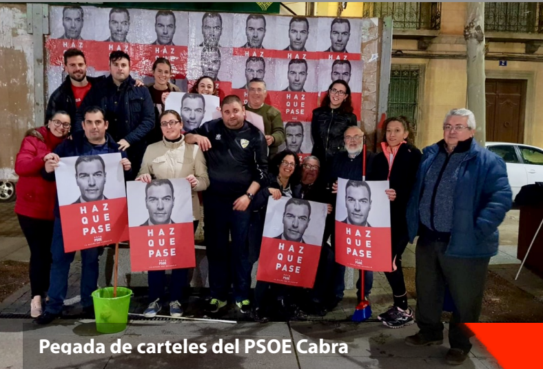
Pegada de carteles del PSOE Cabra