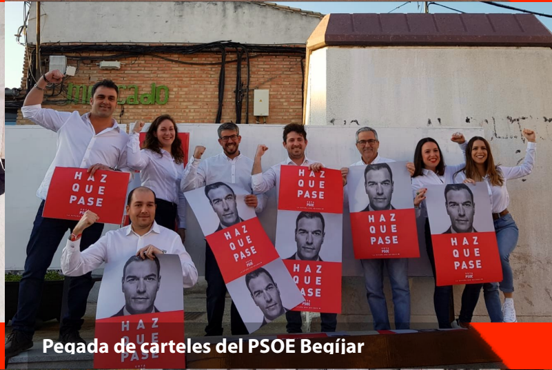
Pegada de carteles del PSOE Bequíjar