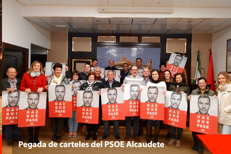
Pegada de carteles del PSOE Alcaudete