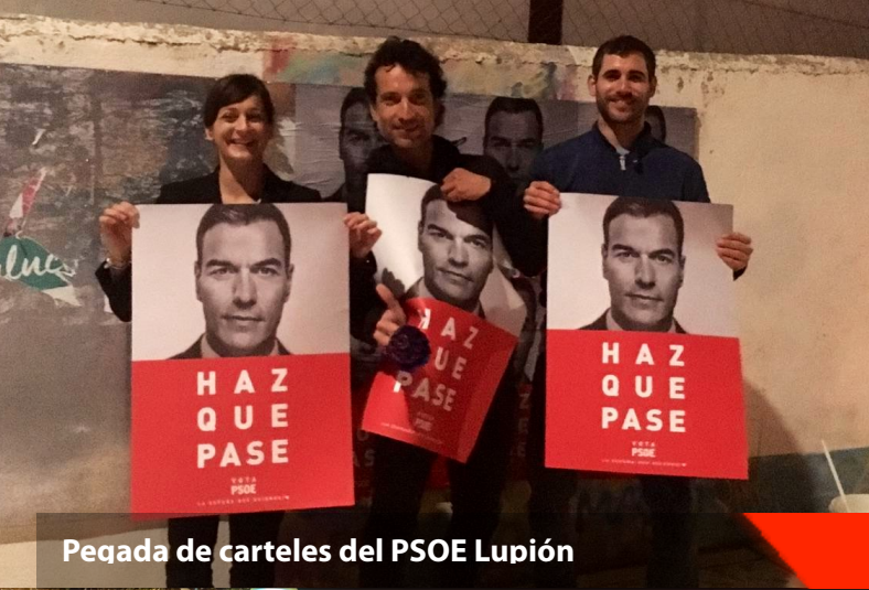
Pegada de carteles del PSOE Lupión