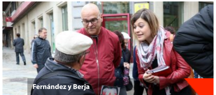
Fernández y Berja

Así las cosas, afirma que el PSOE “es el único partido que garantiza un proyecto de igualdad, un proyecto de futuro donde los derechos de las mujeres se