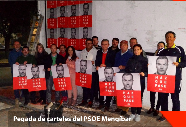
Pegada de carteles del PSOE Mengíbar