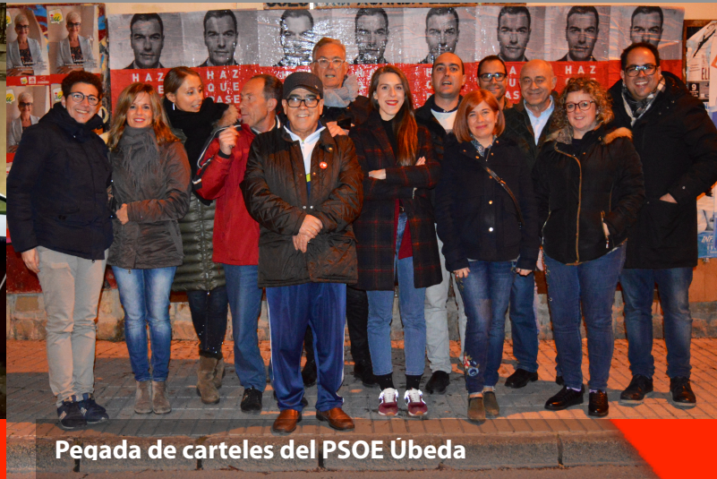
Pegada de carteles del PSOE Úbeda